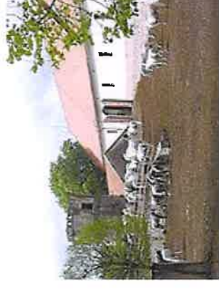
Stutteriet Lipica i Slovenien.

I Frankrig og Tyskland findes der statsstutterier, der skal sikre end særlig høj kvalitet i avlsarbejdet. Fuldblodsstutterier i Frankrig, Irland og England er oftest på private hænder. Halvblodsstutterier koncentrerer sig gerne om nationale racer som Trakhenere, Hannoveranere, Oldenborgere, irske hunte og Dansk Varmblod.